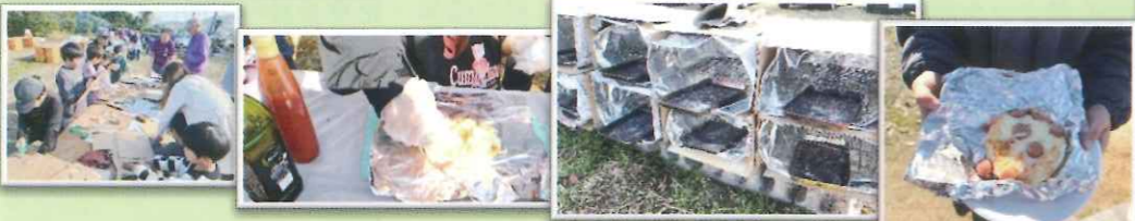
段ボールで作ったピザ窯に炭を入れておいしく焼きあげました！災害時にも活躍できます！

毎年恒例のイベント「下笠居ダッシュ村計画」が下笠居おやじの会を中心に地域ボランティアの方、参加している保護者の方の協力を得て開催されました。段ボールで作った巨大迷路や自分たちだけの基地作りや工作、生地を伸ばす事から挑戦するオリジナルピザ作りなど、ワクワクする体験がいっぱいだった楽しいイベントでした。片づけの時間になり名残惜しくて泣いている子もいて、来年の開催を約束しての解散となりました。