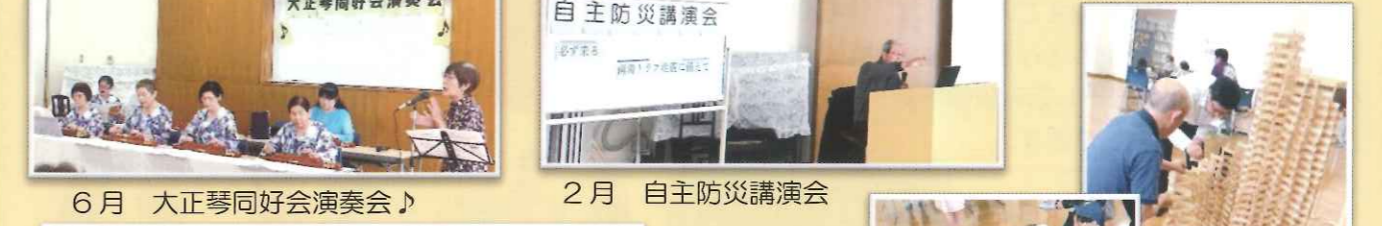
6月 大正琴同好会演奏会♪ 2月 自主防災講演会