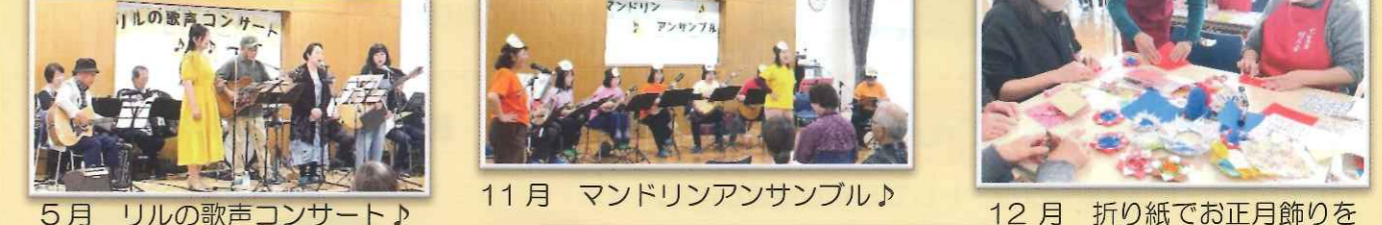
5月 リルの歌声コンサート♪ 11月 マンドリンアンサンブル♪ 12月 折り紙でお正月飾りを作ろう！「婦人会」