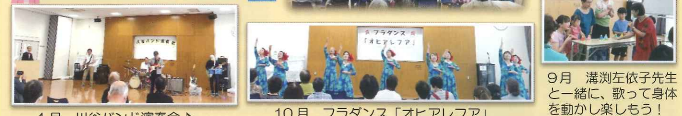
4月 川谷バンド演奏会♪ 10月 フラダンス「オヒアレファ」