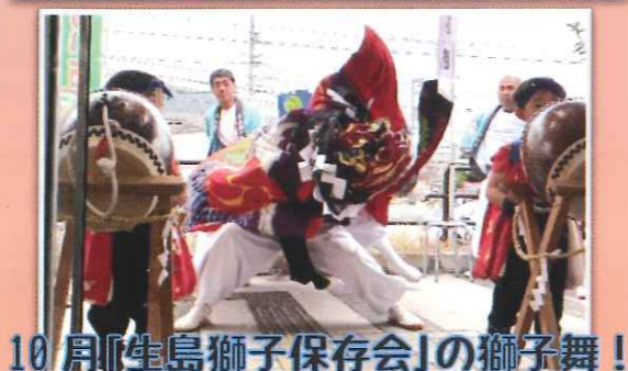
10月「生島獅子保存会」の獅子舞！