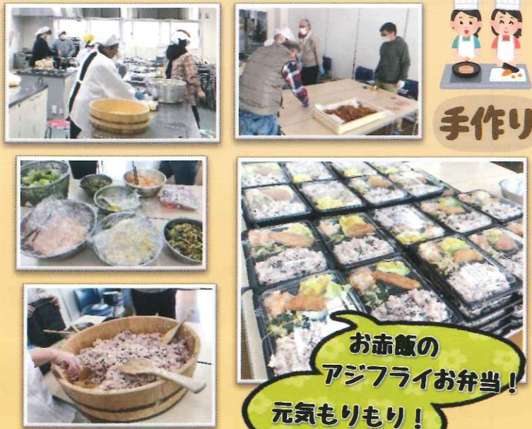
お赤飯のアジフライお弁当！ 元気もりもり！

年間2回、民生委員児童委員の皆さんでひとり暮らし高齢者の方へのお弁当作りを行い、お宅を訪問し、健康や日常の様子などを伺う友愛訪問活動を行っています。