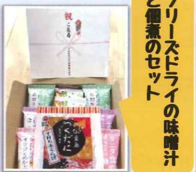
フリースタイルの味噌汁と佃煮のセット

令和7年9月、「敬老祝い品お届け訪問」を民生委員さん中心に協力員さんで行いました。対象の方は1202名でした。(昭和25年12月31日以前に生まれた方)