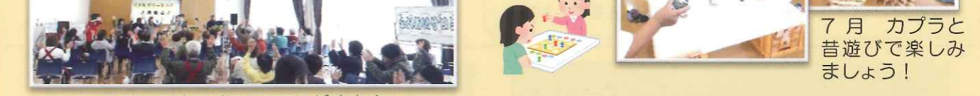
3月 リトルドリーミング演奏会♪ 7月 カブラと昔遊びで楽しみましょう！

ふれあいサロンは下笠居地区社会福祉協議会が主催し、民生委員児童委員の方を中心に、白寿会、婦人会、女性防火クラブ、交通安全母の会の方々のご協力で、(8月と1月を除く)毎月第2日曜日午前9時半からコミュニティセンターで開催しています。毎回趣向を凝らした催しを実施し、子どもから高齢者まで幅広い年代の参加者があります。どなたでも参加できますので是非お越しください。社会福祉士さんやケアマネージャーさんによる「なんでも相談コーナー」も設置していますのでお困りごとなどがあればご利用ください。*参加費100円(小学生以下は無料・飲物代・保険料含む)